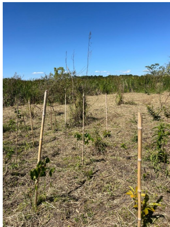
Figura: Imagens nas proximidades da área a ser reflorestada e que já receberam plantio recente pela Fundação José Pedro de Oliveira (FJPO) – Mata de Santa Genebra, 2025.