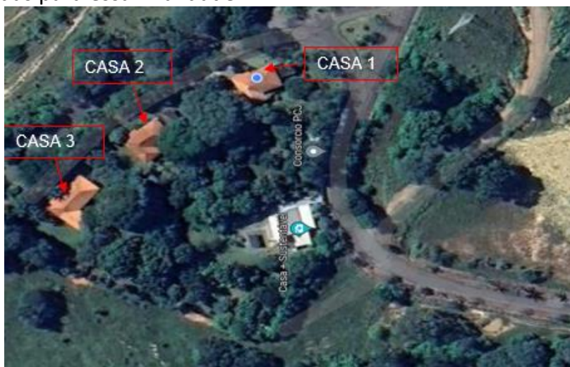
VISTA AÉREA DO LOCAL DA OBRA

O Centro de Referência funciona em 3 (tres) casas, conhecidas como Casa 1, Casa 2 e Casa 3, antigas moradias dos responsáveis pela operação da UT Carioba, que foram adaptadas para essa finalidade.