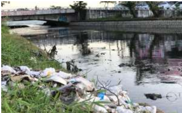
Disposição inadequada dos resíduos