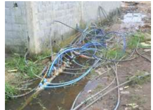
Furto de água